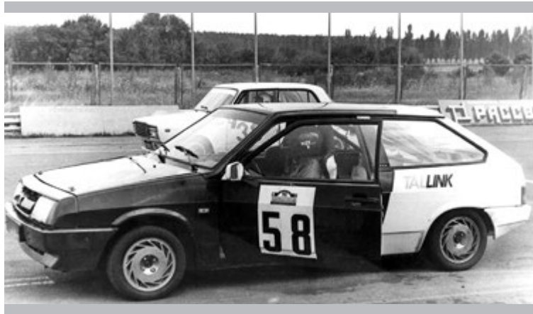
«Колёса» из магния – лёгкость и стремительность

Производительность участка составляла 300 штук в месяц. «Это то количество, которое востребовано пока российским рынком, – говорили тогда наши руководите-