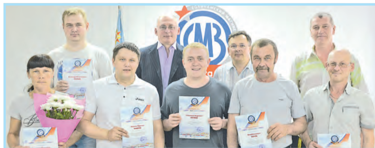
Награждённые цеха № 7