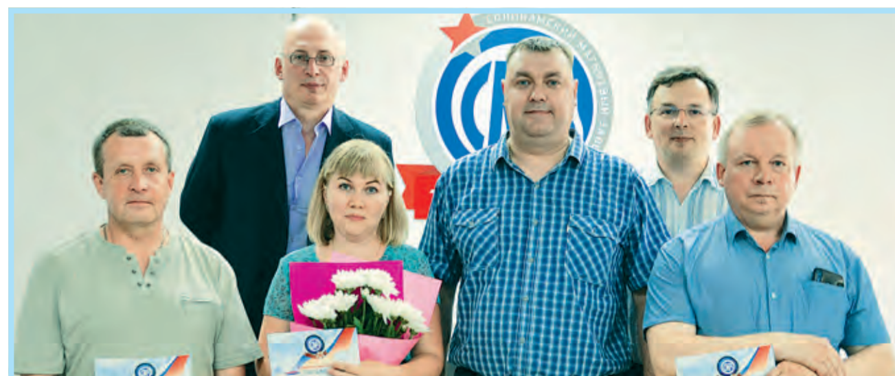
Награждённые цеха № 16