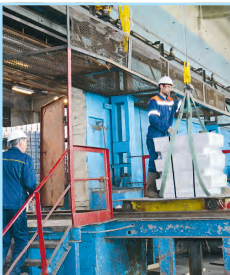
«Экзамен» по упаковке крупногабаритных слитков (цех № 1)