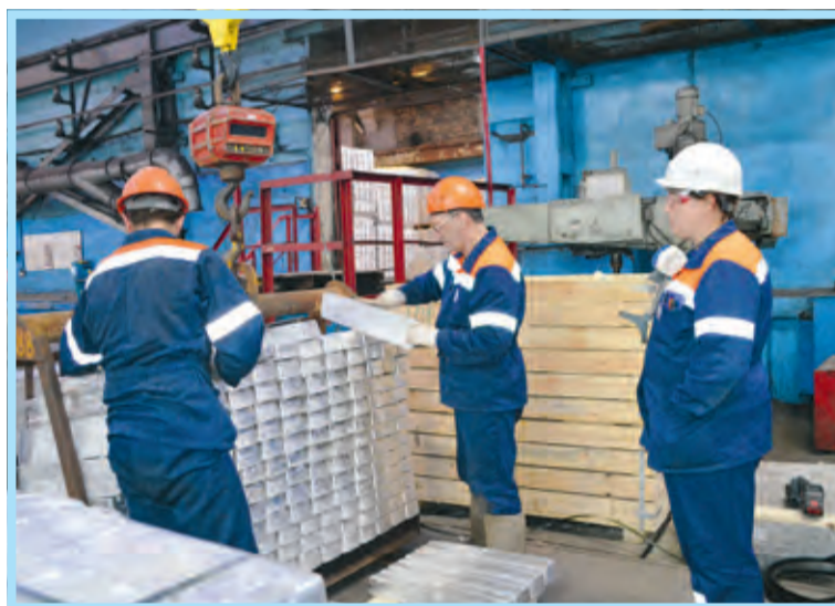
Проверка и упаковка конкурсной партии обязательно идёт ещё и под «надзором» контролёра ОТК (цех № 1)