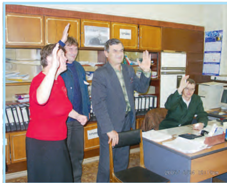
Так проходило голосование конкурсной комиссии цеха № 4

Одним из самых насыщенных на конкурсы был год 2005-й. На заводе уже полным ходом шла подготовка к грядущему (в марте 2006-го) 70-летию. И в Положении о проведении конкурсов тогда появилось одно новшество: победа в конкурсе стала обя-