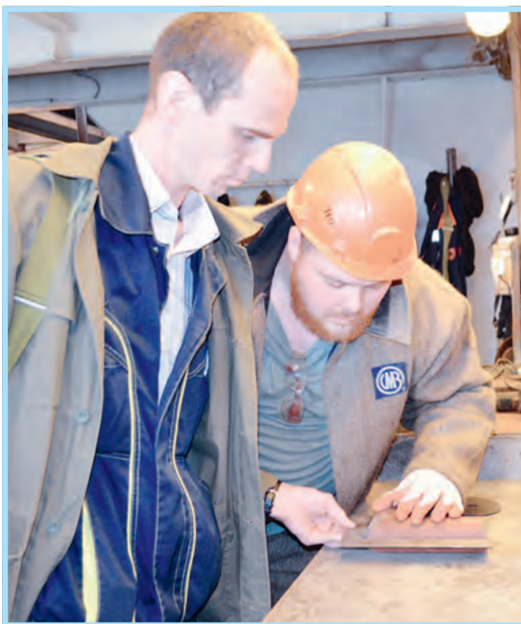
Сдача своего конкурсного задания строгой комиссии (цех №7)