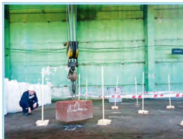
Демонстрация точности и сноровки – конкурс крановщиков в цехе № 7