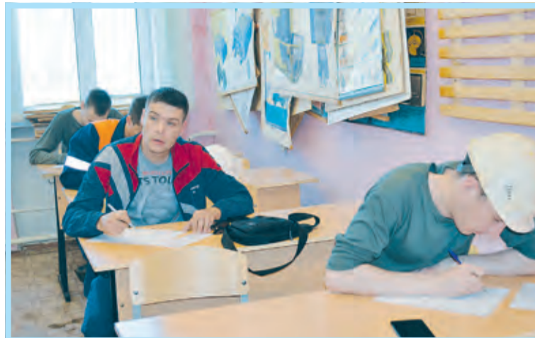
Теория – такая же обязательная часть конкурсной «программы» (цех № 1)

Пятнадцать номинаций. Более сотни участников. Зрелищность и красота вдохновенного труда. Порой – захватывающая дух сложность, иногда – обманчивая внешняя простота выполняемого конкурсного задания. Предстартовое волнение участников, а где-то, наоборот, их же солидная уверенность: «Чего же волноваться, ведь выполняли-то мы то же самое, что делаем в своей повседневной работе!». Радость победы: «Могу!». Досада неудачи: «Половины очка (или – одного, двух, трёх) до первого места не хватило!». Вот что такое конкурс профессионального мастерства-2022!