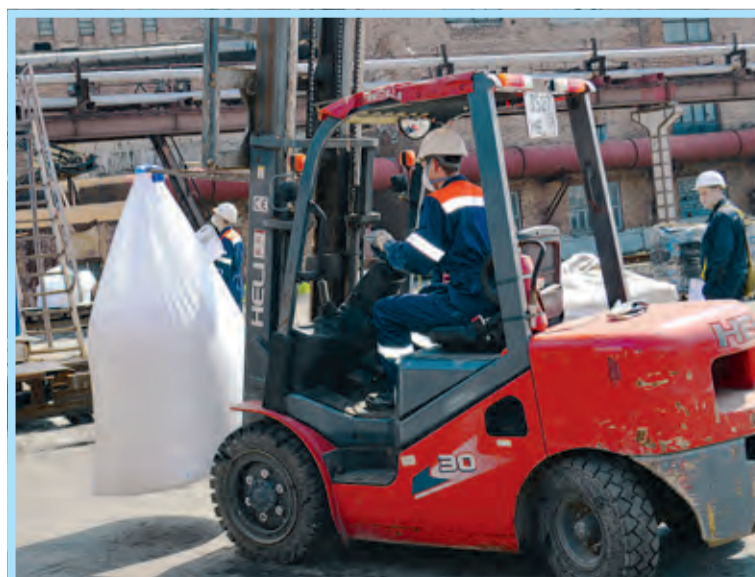
Транспортировка подготовленной к отправке партии – одна из операций конкурса дробильщиков (цех № 1)