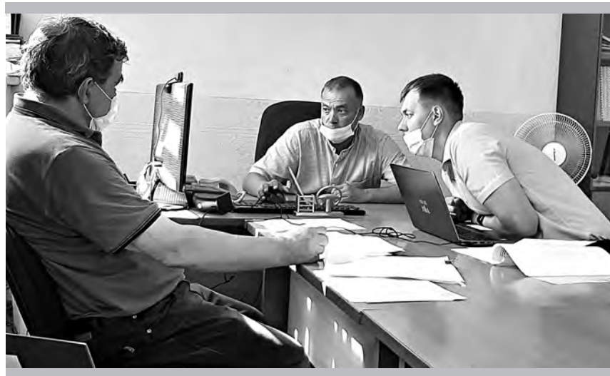
Аудит в цехе № 11