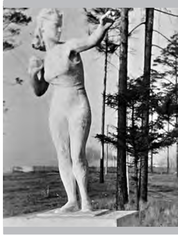
Одна из скульптур

Особенно многолюдно в парке было в праздничные дни. К профессиональному празднику на центральной аллее вывешивали портреты лучших заводчан. И, конечно, само празднование проходило