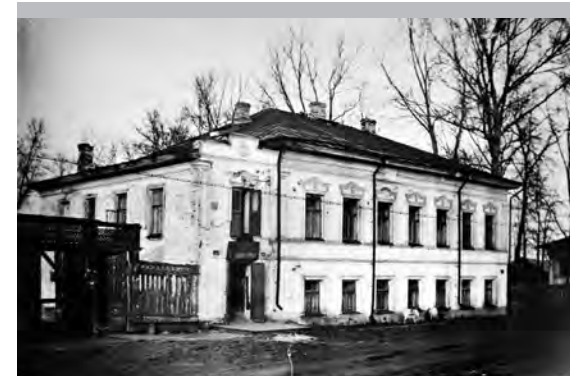
Городская амбулатория, бывший Барановский дом, где была провозглашена Советская власть

Накануне Дня города, как и в прошлом году, мы публикуем фотографии Соликамска и столетней давности, и середины прошлого века, и более поздние. Места, между прочим, узнаваемые. Поэтому изучать эти снимки очень интересно!