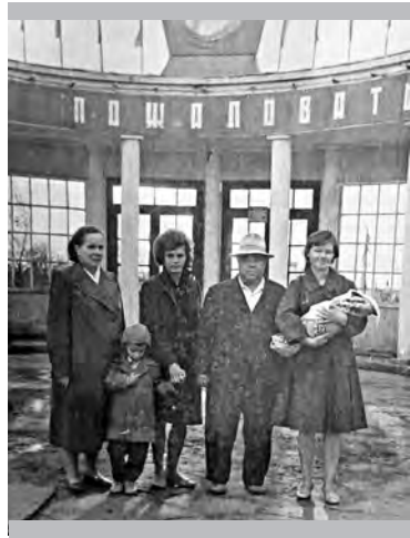
Вход в парк

Военное лихолетье не пощадил и это излюбленное горожанами место. Свидетельство тому — материал в заводской газете «Магниевики» от 18-