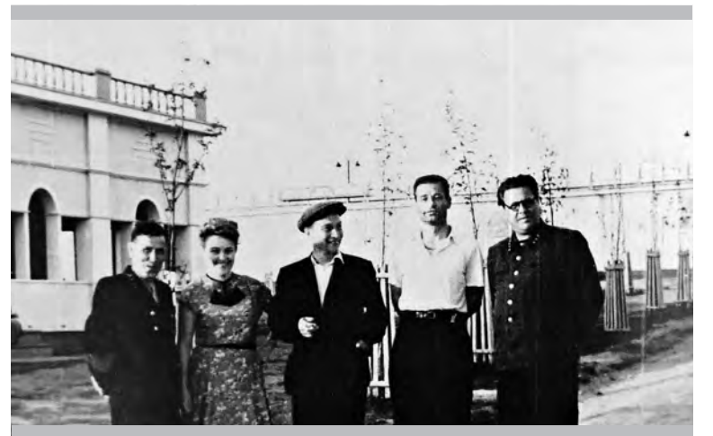
Летний кинотеатр в парке