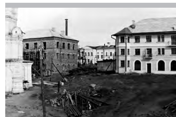
Строительство нового дома (середина 50-х годов прошлого века)