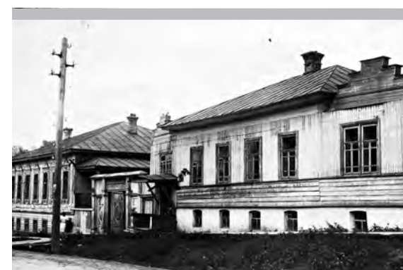
Управление милиции по улице III-го Интернационала (сейчас — 20-летия Победы)