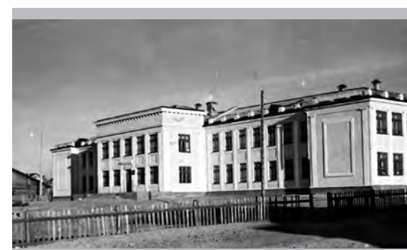
Школа № 5 (1955-й год)