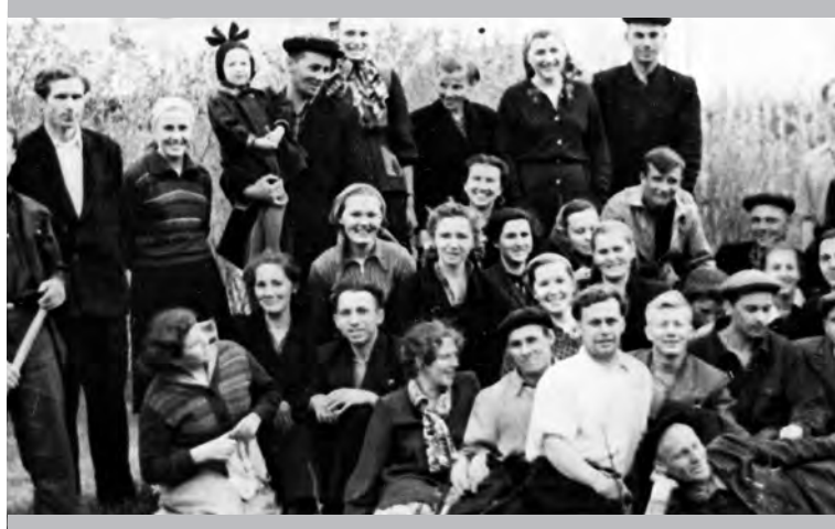
Заводские комсомольцы на субботнике по озеленению парка

тественные награды, значки «Отличники социалистического соревнования Российской Федерации», почётные грамоты совпрофа и совнархоза. После торжественного собрания для его участников спектакль Кизеловского драмтеатра».